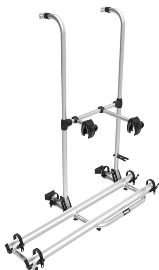
Trasporta fino a 2 bici