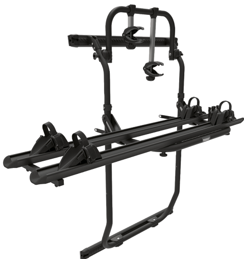
Trasporta fino a 2 bici